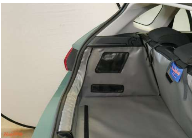
SH2-FRSD-mit Lautsprecher- linke Seite