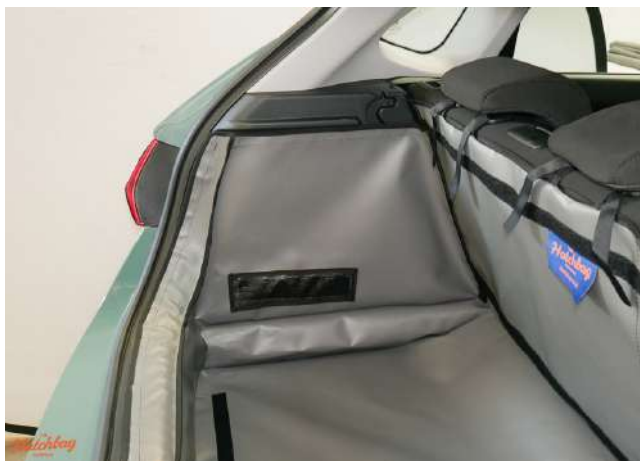
SH2-FSH1-kein Lautsprecher - linke Seite