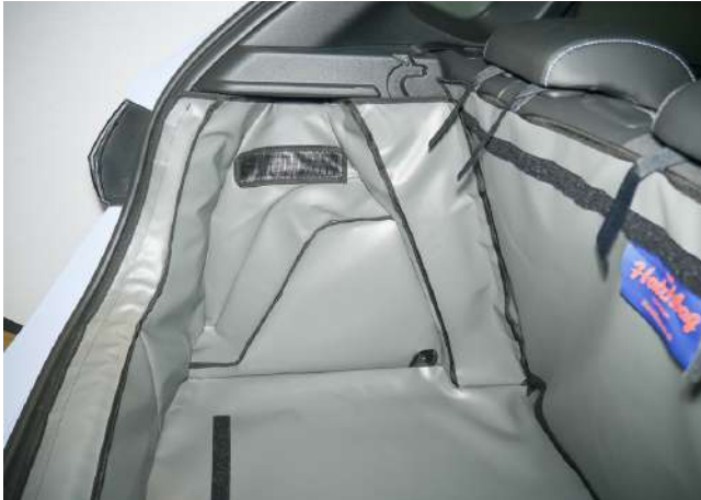
SH1-FNO - linke Seite