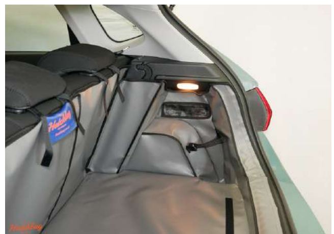
SH2-FRSD-mit Lautsprecher- rechte Seite