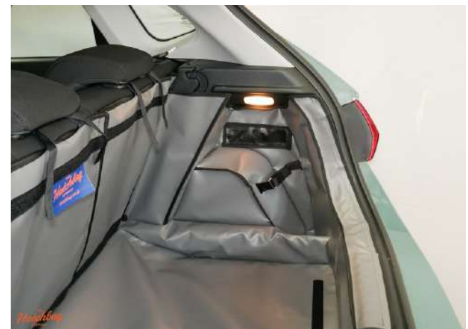
SH2- FSH1-kein Lautsprecher - rechte Seite