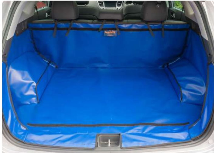
Bild zeigt Kofferraumschutz mit Rücksitz Plus vorbereitet für den Rücksitzschoner und Stoßtangenschutz