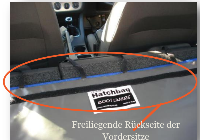
Freiliegende Rückseite der Vordersitze