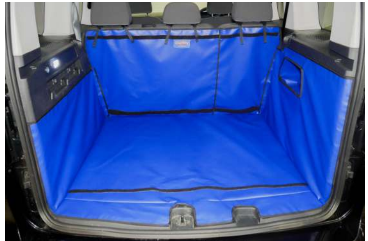
Bild zeigt Kofferraumschutz mit geteiltem Rücksitz, vorbereitet für Stoßstangenschutz, Rücksitzschoner und Verlängerung der Kofferraumauskleidung