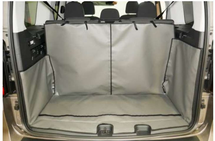
Bild zeigt Kofferraumschutz mit geteiltem Rücksitz, vorbereitet für Stoßstangenschutz, Rücksitzschoner und Verlängerung der Kofferraumauskleidung