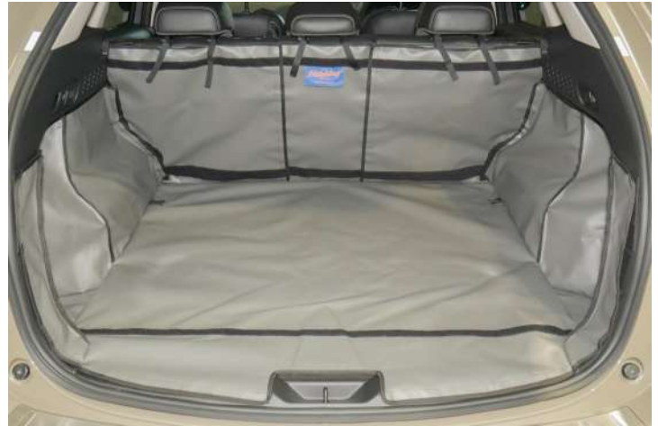
Bild zeigt Kofferraumschutz mit geteiltem Rücksitz, vorbereitet für Stoßstangenschutz, Rücksitzschoner und Verlängerung der Kofferraumauskleidung