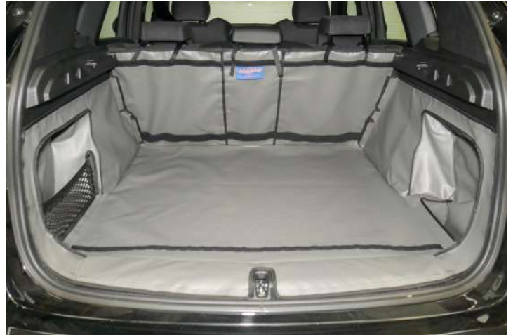
Bild zeigt Kofferraumschutz mit geteiltem Rücksitz, vorbereitet für Stoßstangenschutz, Rücksitzschoner und Verlängerung der Kofferraumauskleidung