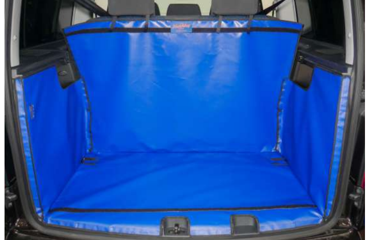
Bild zeigt Rücksitz Plus, vorbereitet für Stoßstangenschutz und Rücksitzschoner