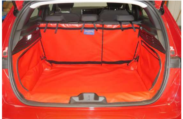
Bild zeigt Kofferraumschutz mit geteiltem Rücksitz, vorbereitet für Stoßstangenschutz, Rücksitzschoner und Verlängerung der Kofferraumsauskleidung