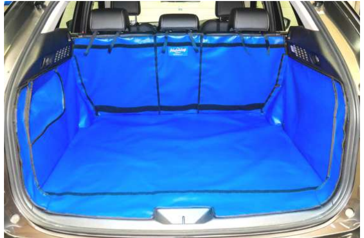
Bild zeigt Kofferraumschutz mit geteiltem Rücksitz, vorbereitet für Stoßstangenschutz, Rücksitzschoner und Verlängerung der Kofferraumauskleidung