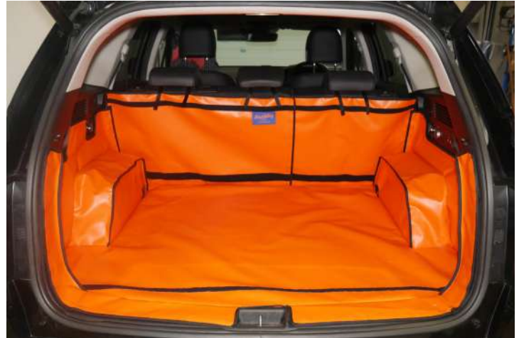
Bild zeigt Kofferraumschutz mit geteiltem Rücksitz, vorbereitet für Stoßstangenschutz, Rücksitzschoner und Verlängerung der Kofferraumauskleidung