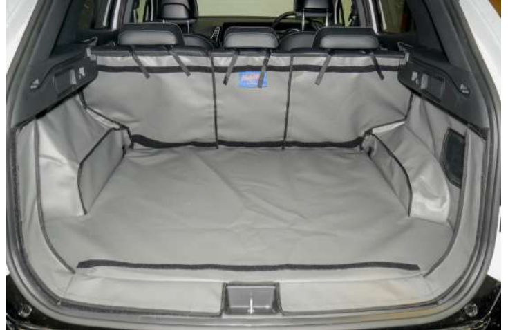
Bild zeigt FRSD Kofferraumschutz mit geteiltem Rücksitz, vorbereitet für Stoßstangenschutz, Rücksitzschoner und Verlängerung der Kofferraumauskleidung