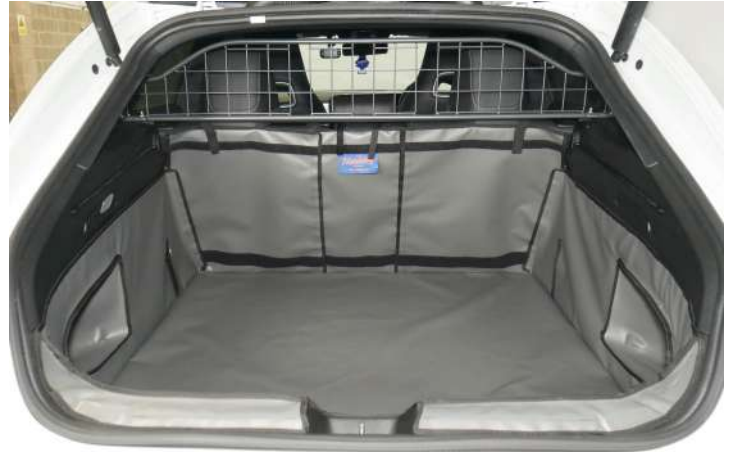
SH1-NETNO- Kofferraumschutz mit geteiltem Rücksitz, vorbereitet für Rücksitzschoner und Verlängerung der Kofferraumauskleidung