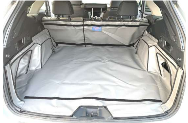
Bild zeigt Kofferraumschutz mit geteiltem Rücksitz, vorbereitet für Stoßstangenschutz, Rücksitzschoner und Verlängerung der Kofferraumauskleidung