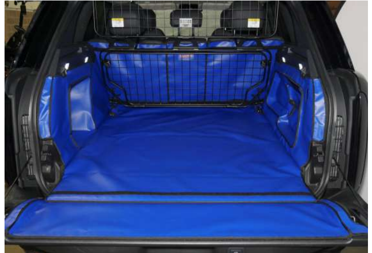
Bild zeigt Kofferraumschutz mit geteiltem Rücksitz, vorbereitet für Stoßtangenschutz, Rücksitzschoner und Verlängerung der Kofferraumauskleidung