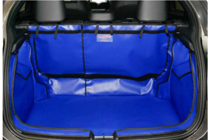
Bild zeigt Kofferraumschutz mit geteiltem Rücksitz, vorbereitet für Stoßstangenschutz, Rücksitzschoner und Verlängerung der Kofferraumauskleidung