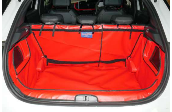
Bild zeigt Kofferraumschutz mit geteiltem Rücksitz, vorbereitet für Stoßstangenschutz, Rücksitzschoner und Verlängerung der Kofferraumauskleidung