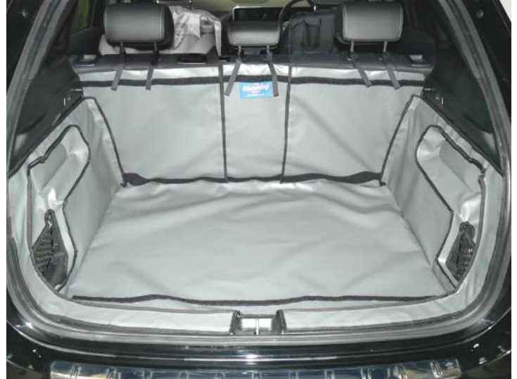
Kofferraumschutz "Geteilter Rücksitz" vorbereitet für Stoßstangenschutz, Rücksitzschoner und Verlängerung