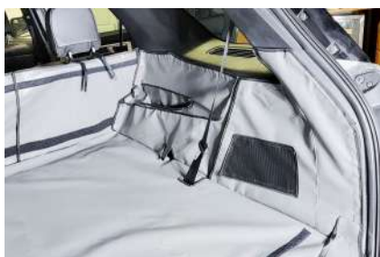
Bild H - R3FLD - Seitenauskleidung