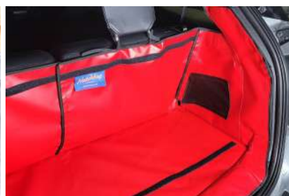
Bild I - R3USE - Seitenauskleidung