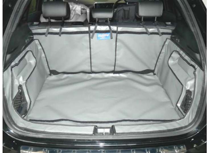
Kofferraumschutz "Geteilter Rücksitz" vorbereitet für Stoßstangenschutz, Rücksitzschoner und Verlängerung