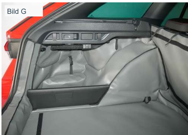
Kofferraumschutz linke Seite SH1