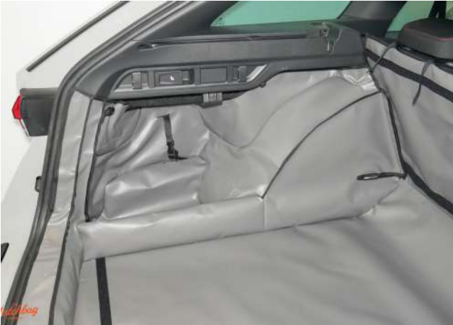
SH2- Kofferraumschutz linke Seite