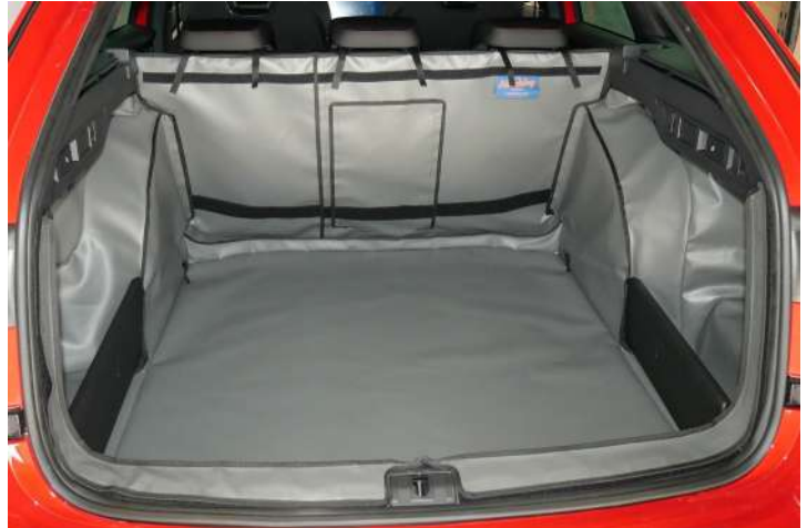
Kofferraumschutz "Geteilter Rücksitz mit Skidurchreiche" vorbereitet für Rücksitzschoner und Verlängerung