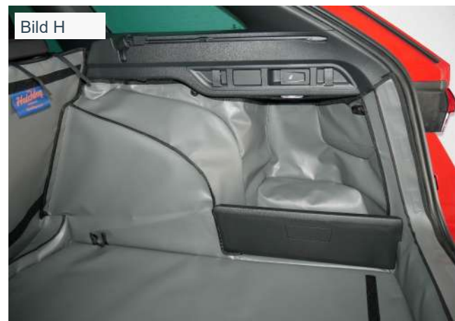
Kofferraumschutz rechte Seite SH1