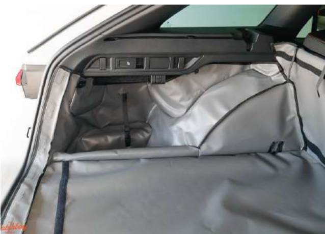
SH4- Hybrid- Kofferraumschutz linke Seite