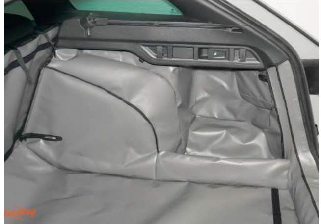
SH2- Kofferraumschutz rechte Seite