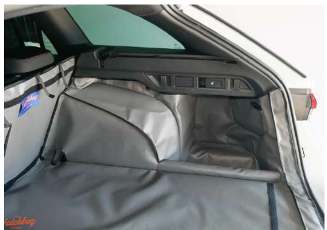
SH4- Hybrid- Kofferraumschutz rechte Seite