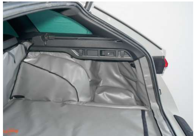
SH3- Kofferraumschutz rechte Seite