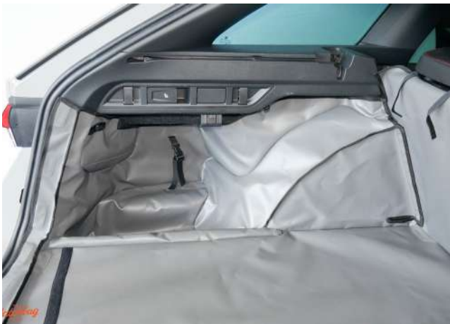
SH3- Kofferraumschutz linke Seite