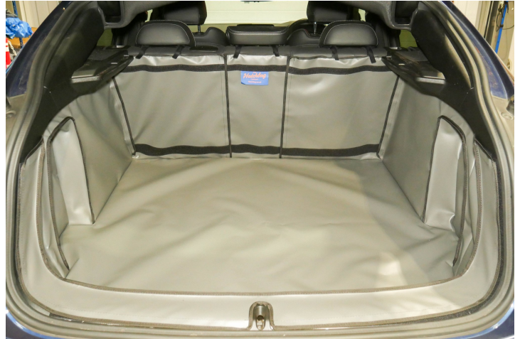
Bild zeigt Kofferraumschutz mit geteiltem Rücksitz, vorbereitet für Stoßstangenschutz, Rücksitzschoner und Verlängerung der Kofferraumauskleidung