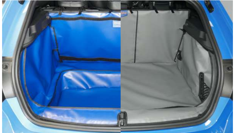
Foto links: FOUT geteilter Rücksitz vorbereitet für Stoßstangenschutz und Verlängerung

Foto rechts: FIN geteilter Rücksitz, vorbereitet für Stoßstangenschutz