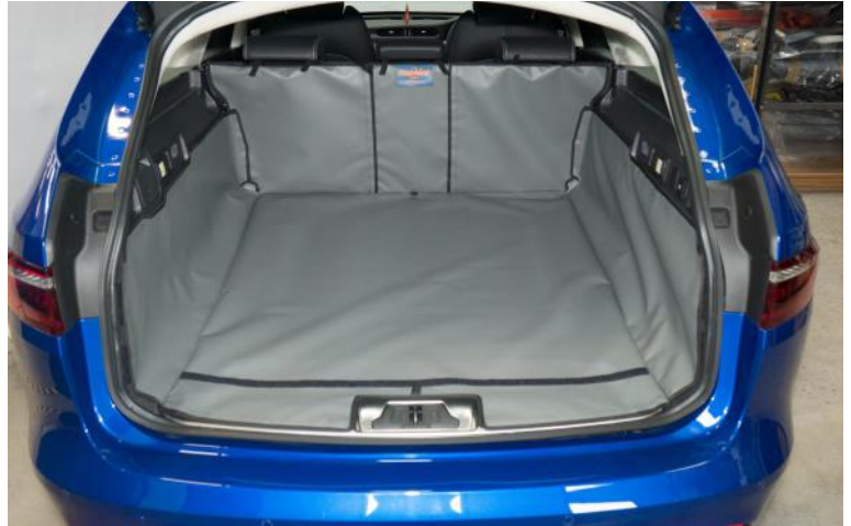
Bild zeigt Kofferraumschutz mit geteilter Rücksitz, vorbereitet für den Stoßstangenschutz