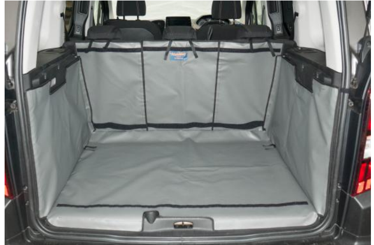
Bild zeigt Kofferraumschutz mit geteilter Rücksitz, vorbereitet für die Stoßstangenschutz, Rücksitzschoner und Verlängerung der Kofferraumauskleidung