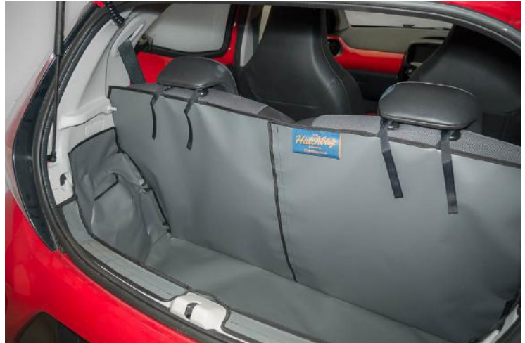
Kofferraumauskleidung mit geteiltem Rücksitz