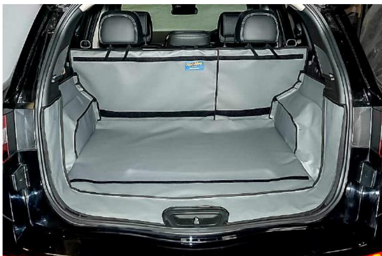
Bild zeigt Kofferraumschutz "Geteilter Rücksitz", vorbereitet für den Rücksitzschoner, Stoßtangenschutz und die Verlängerung