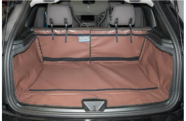
Bild zeigt Kofferraumschutz vorbereitet für den Sitzschoner und Stoßstangenschutz und Verlängerung der Kofferraumauskleidung