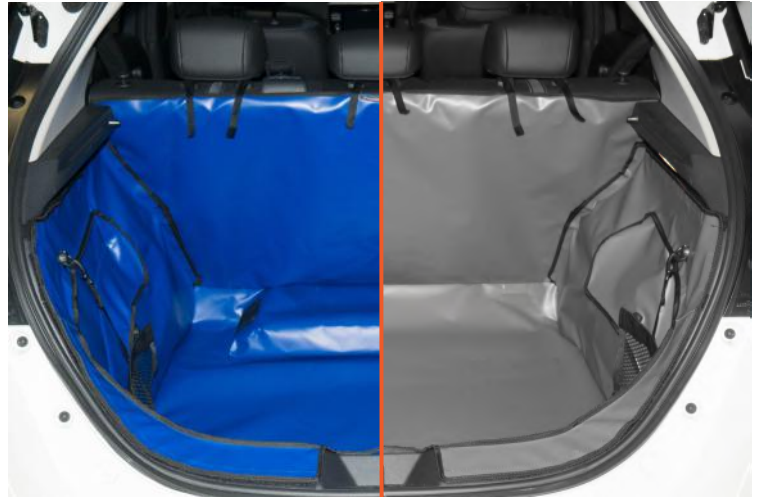
SPK-Kofferraum mit Lautsprecher /SPKNO–ohne Lautsprecher Kofferraumschutz mit Rücksitz Plus