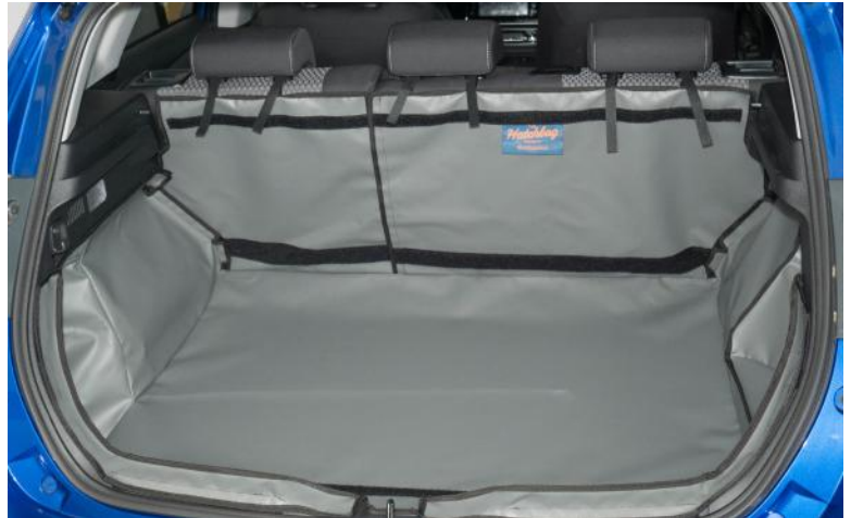
Bild zeigt Kofferraumschutz mit geteilter Rücksitz, vorbereitet für den Stoßstangenschutz, Rücksitzschoner und Verlängerung der Kofferraumauskleidung