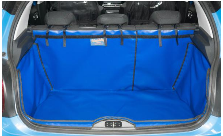
Bild zeigt kofferraumschutz mit geteilter Rücksitz, vorbereitet für den Rücksitzschoner