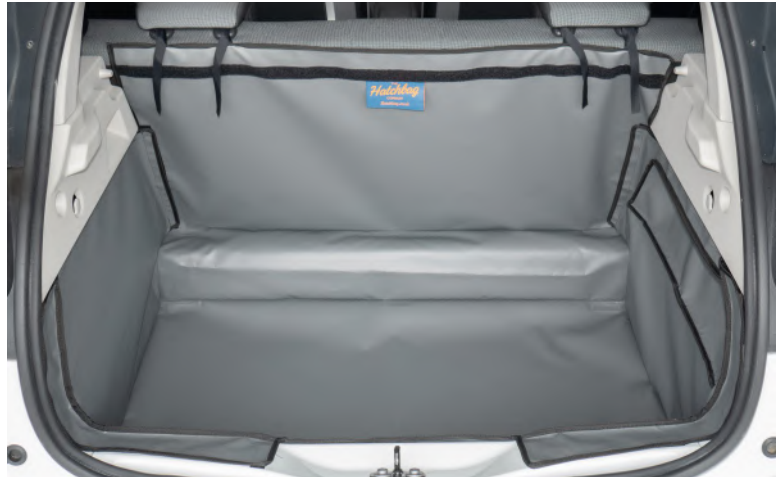
Bild zeigt Kofferraumschutz mit geteilter Rücksitz, vorbereitet für den Rücksitzschoner