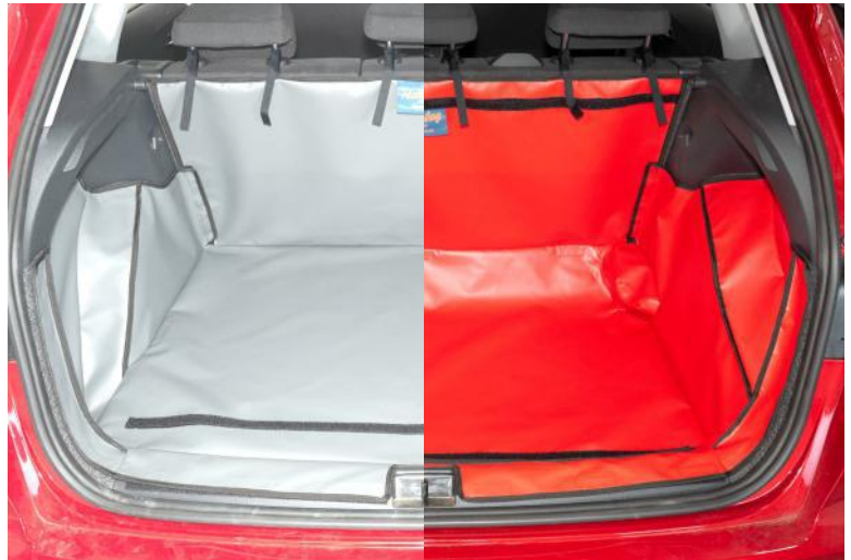
Bild links zeigt: Erhöhtem Boden Bild rechts zeigt: Niedrigem Boden

(Kofferraumauskleidungen sind vorbereitet für den Stoßstangenschutz und Rücksitzschoner)