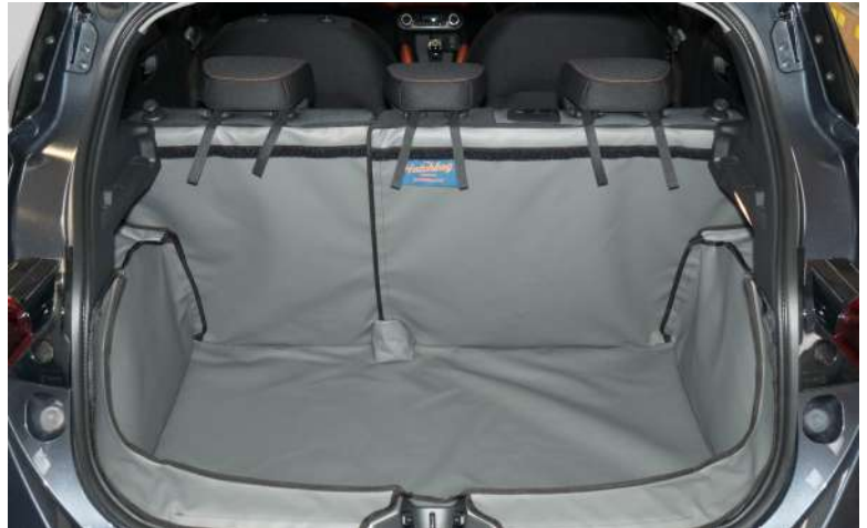
Bild zeigt Kofferraumschutz mit geteilter Rücksitz vorbereitet für den Rücksitzschoner