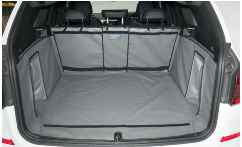
Bild zeigt Kofferraumschutz mit geteilter Rücksitz, vorbereitet für den Rücksitzschoner, Stoßtangenschutz und Verlängerung der Kofferraumauskleidung