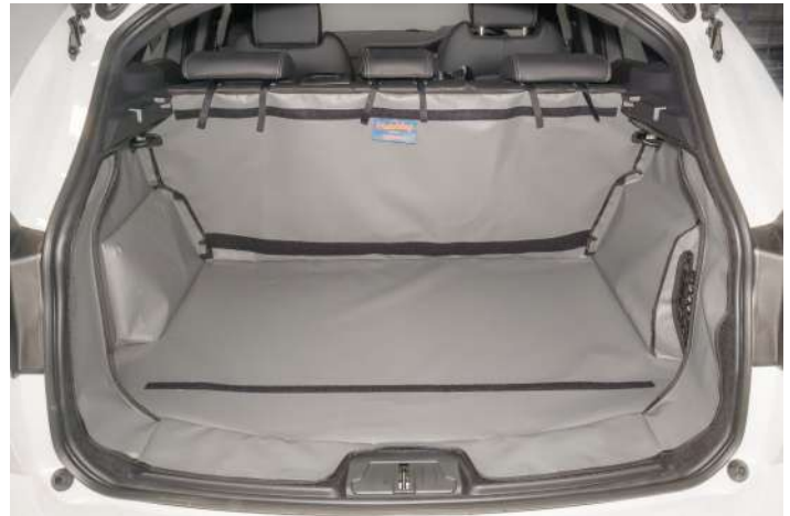
Kofferraumauskleidung mit Rücksitz Plus mit vorbereitungen für den Stoßtangenschutz, den Rücksitzschoner und die Verlängerung der Kofferraumauskleidung