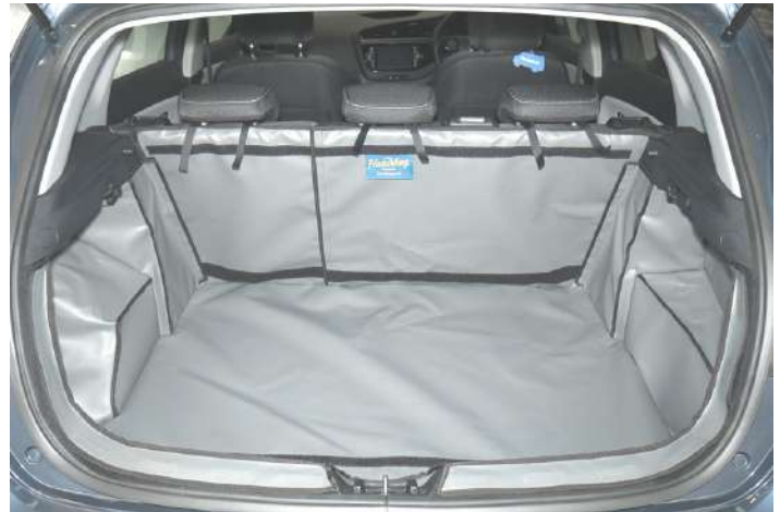
Bild zeigt Kofferraumschutz mit geteilter Rücksitz vorbereitet für den verlängerung der Kofferraumauskleidung und Rücksitzschoner