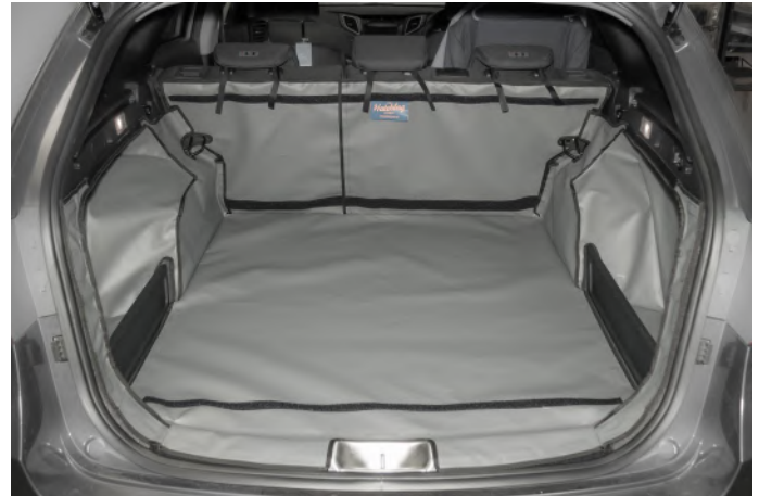
Kofferraumschutz mit geteilter Rücksitz mit Kunststoffplatte, vorbereitet für den Stoßstangenschutz, Rücksitzschoner und Verlängerung der Kofferraumauskleidung