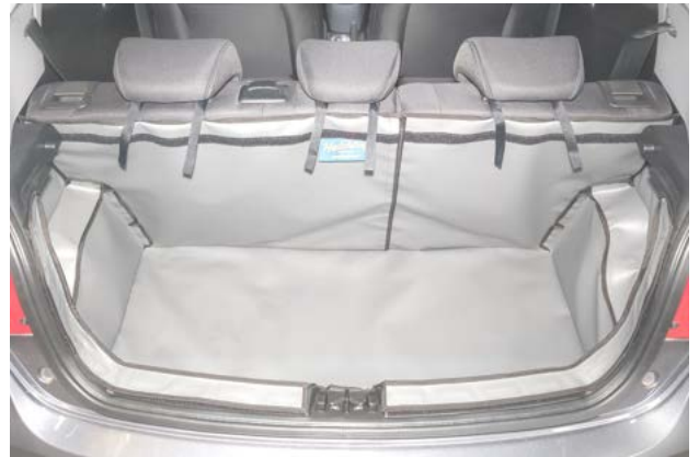
Split bootliner with seatflap prep