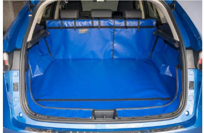
Kofferraumschutz "Geteilter Rücksitz", vorbereitet für den Stoßstangenschutz und Rücksitzschoner