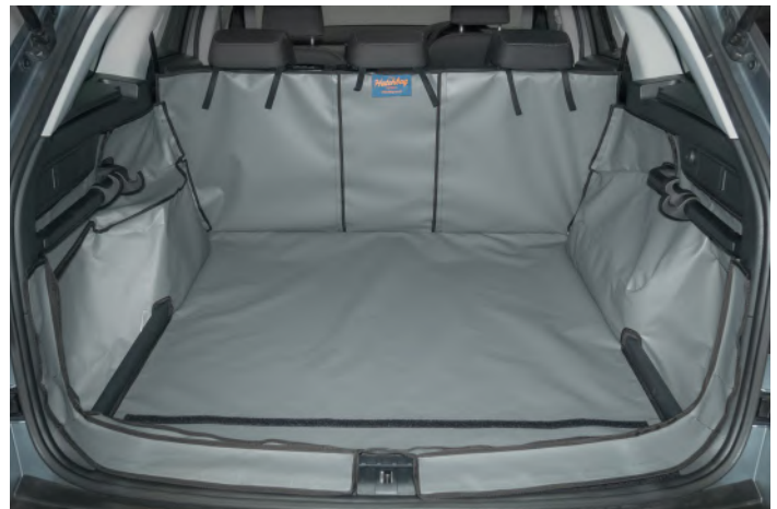
Bild zeigt Kofferraumauskleidung Version "Geteilter Rücksitz" vorbereitet für den Stoßstangenschutz