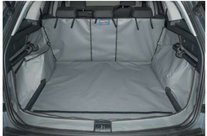
Bild zeigt Kofferraumauskleidung Version "Geteilter Rücksitz" vorbereitet für den Stoßstangenschutz