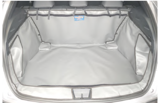
Kofferraumauskleidung mit Rücksitz Plus vorbereitet für den Rücksitzschoner und Stoßstangenschutz