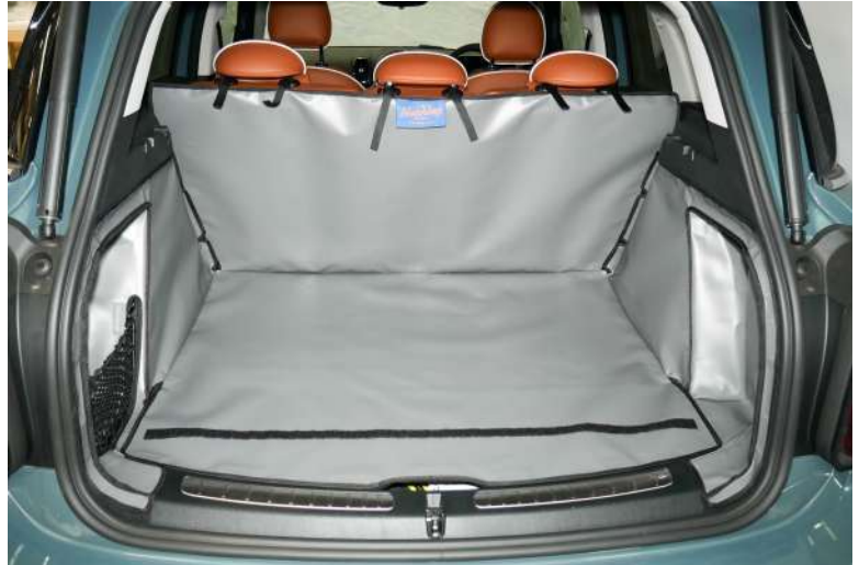
Ausführung "Rücksitz Plus", Variante NET, Vorbereitet für Stoßstangenschutz