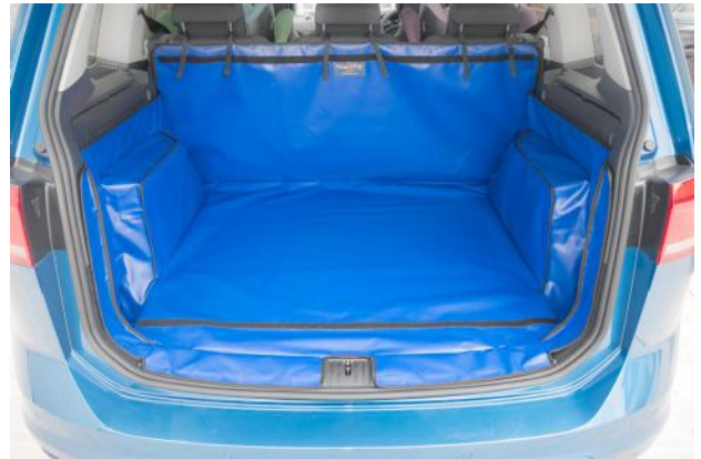
Standard Kofferraumauskleidung mit Stoßstangenschutz und Rücksitzschoner vorbereitungen