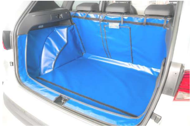
Keine Vario Boden Version—Kofferrraumauskleidung mit geteilter Rücksitz und Skidurchreiche FNO-FRSD