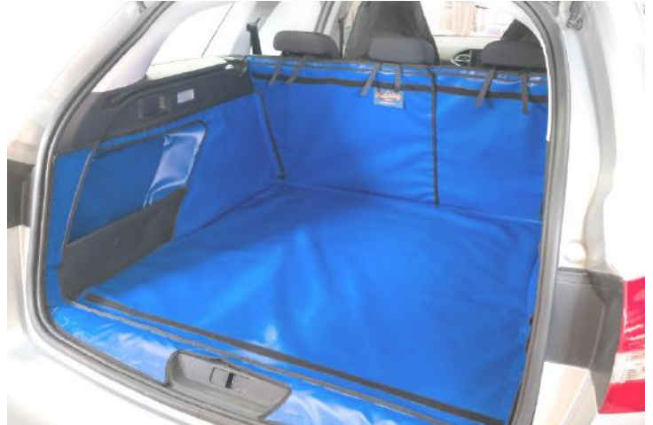
Kofferraumauskleidung mit geteilter Rücksitz vorbereitet für den Stoßtangenschutz und Rücksitzschoner