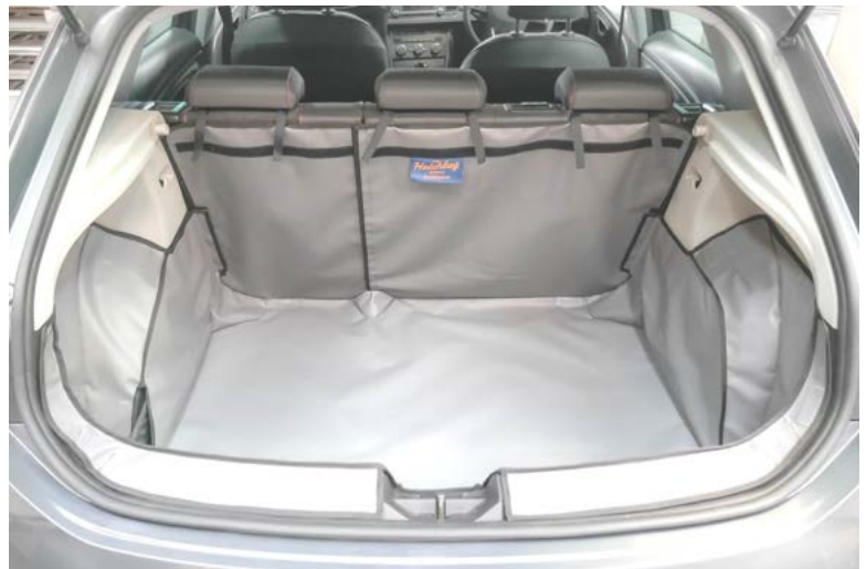
Kofferraumauskleidung mit geteilter Rücksitz