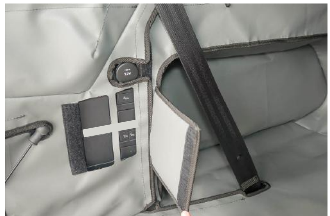
Ausspraug Fahrerseite (Nahaufnahmme)