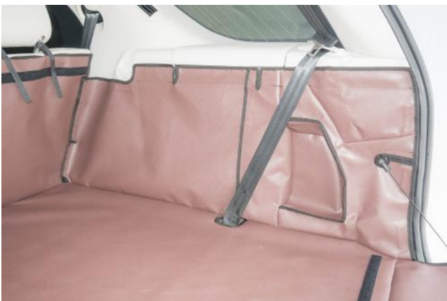
All Versionen Beifahrerseite