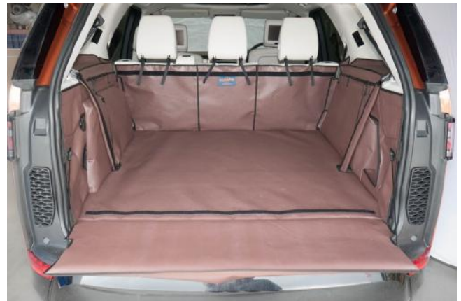
Kofferraumschutz "Geteilter Rücksitz", vorbereitet für den Stoßtangenschutz und Rücksitzschoner