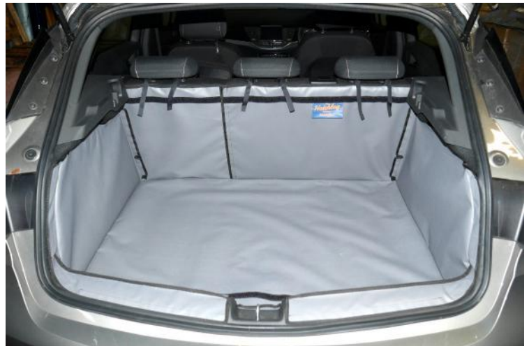
Bild zeigt Kofferraumschutz Version "Geteilter Rücksitz", vorbereitet für Rücksitzschoner